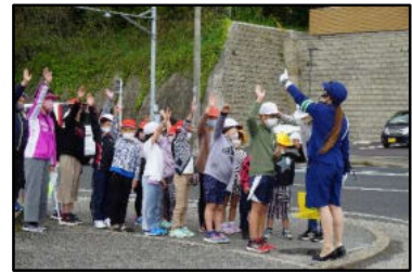
【交通指導を受ける子供達】