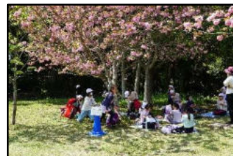
【体育館での歓迎集会和遠足】