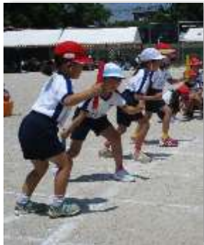
スタートの緊張感

なお、6月19日から23日までの5日間は「心を見つめる教育週間」です。くらしの中で困っていることや悩んでいることなど、アンケートや個人面談をとおして一人ひとりの心にしっかり寄り添いながら、安心して生活できる学校づくりに努めてまいります。