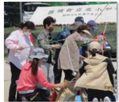
今日は大漁 よか天気