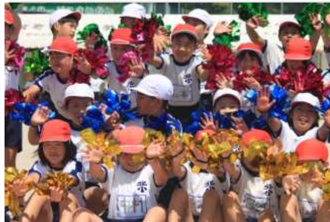
十人十色の笑顔咲く