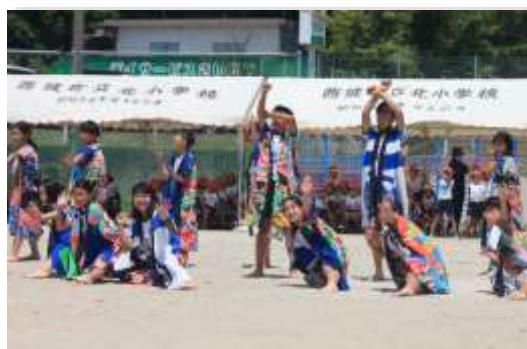
北小を引っ張る心意気